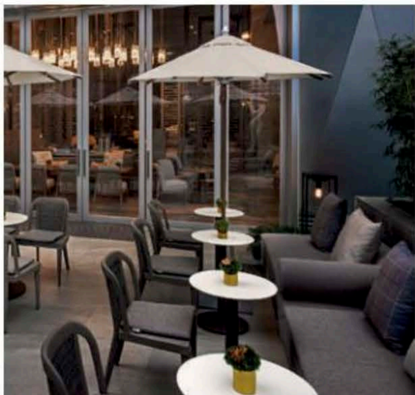
La terrazza del St.Regis di Hong Kong, con i pezzi della collezione Rock Garden prodotta da Janus et Cie (design André Fu). L'azienda statunitense, appartenente a Design Holding, è molto forte nelle forniture alle navi da crociera