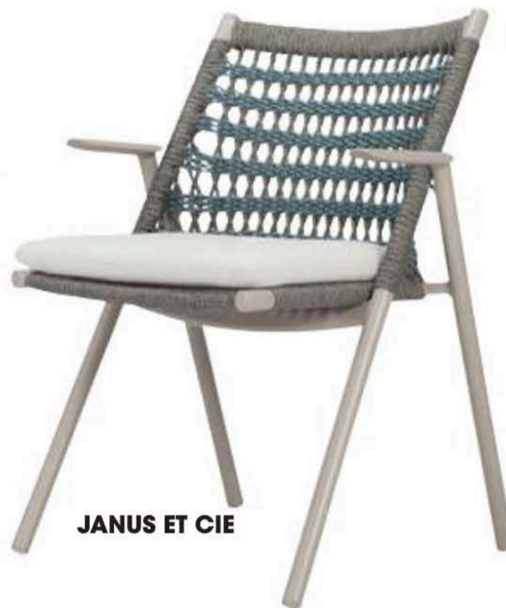
JANUS ET CIE

EMU Il dondolo RIO R50, design Gargano-Cristell ha una struttura in tubo di acciaio di tipologia ASFORM, acciaio di alta qualità con elevate capacità meccaniche ed è disponibile in 12 colori.