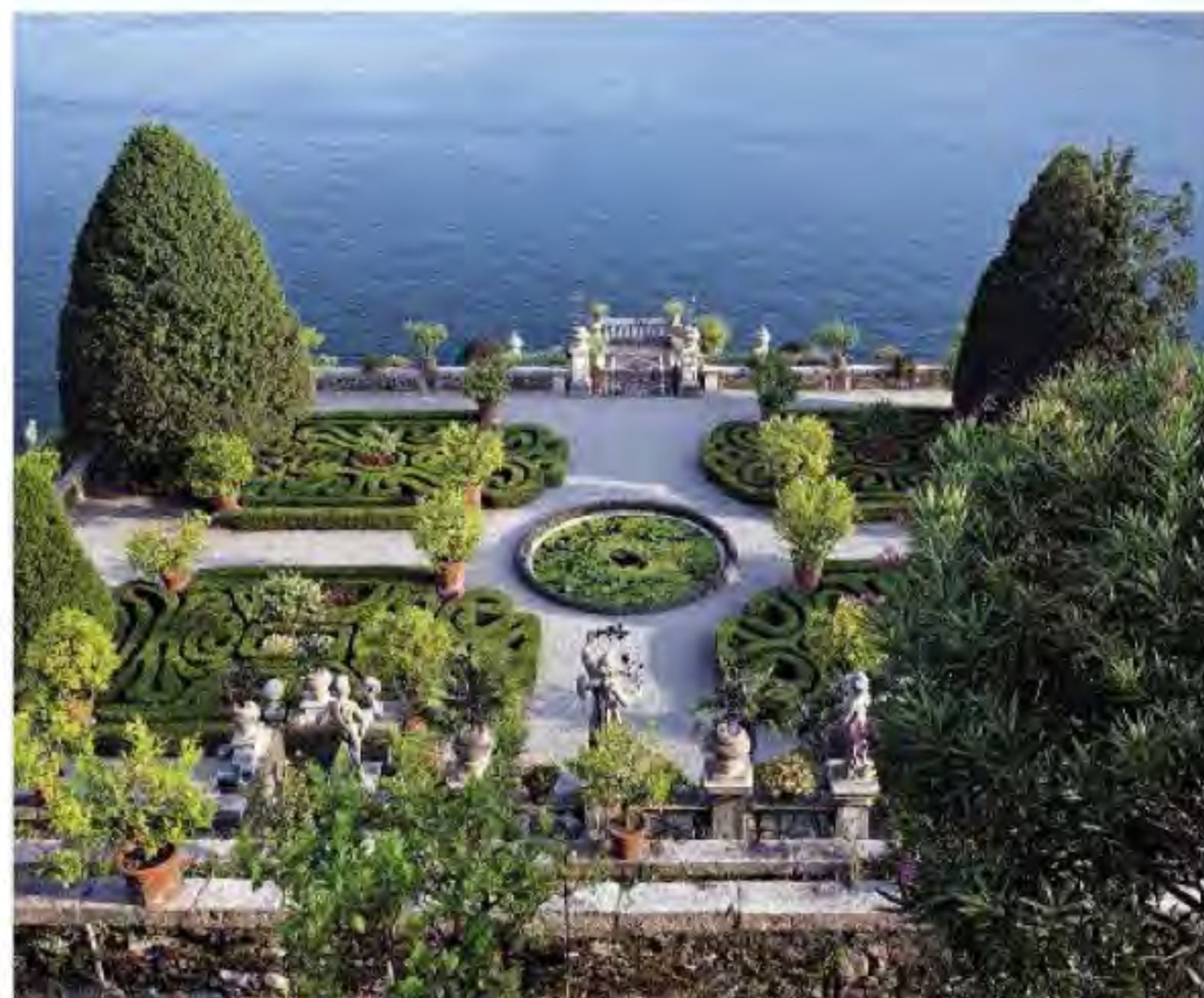
SOPRA: il giardino formale dell'Isola Bella, sul Lago Maggiore.